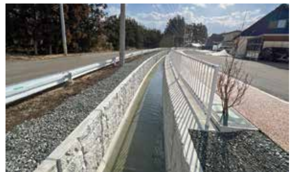
村崎野幹線用水路（R6完成）

東北農政局 和賀中央農業水利事業所 〒024-0062 岩手県北上市鍛冶町一丁目 11-58 TEL 0197-62-0755 FAX 0197-62-0786