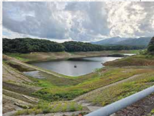
【千貫石ため池渇水状況】

例年と同じく中干し期に取水制限を行い貯水率の回復を図ったが、少雨により貯水率が回復せず、8月以降も回復が出来ないまま、かんがい期終了となる。