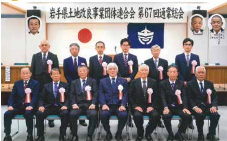
令和6年度 土地改良功労者表彰