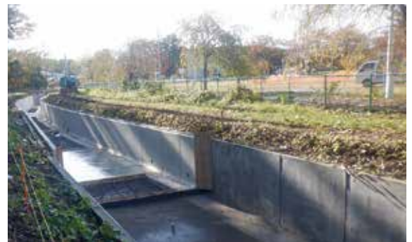
下堰幹線用水路（R7実施中）

令和9年度の事業完成に向けまして、事業所職員一同、事業推進に取り組んでまいりますので、引き続き皆様方の国営土地改良事業へのご理解、ご協力を賜りますようお願い申し上げます。